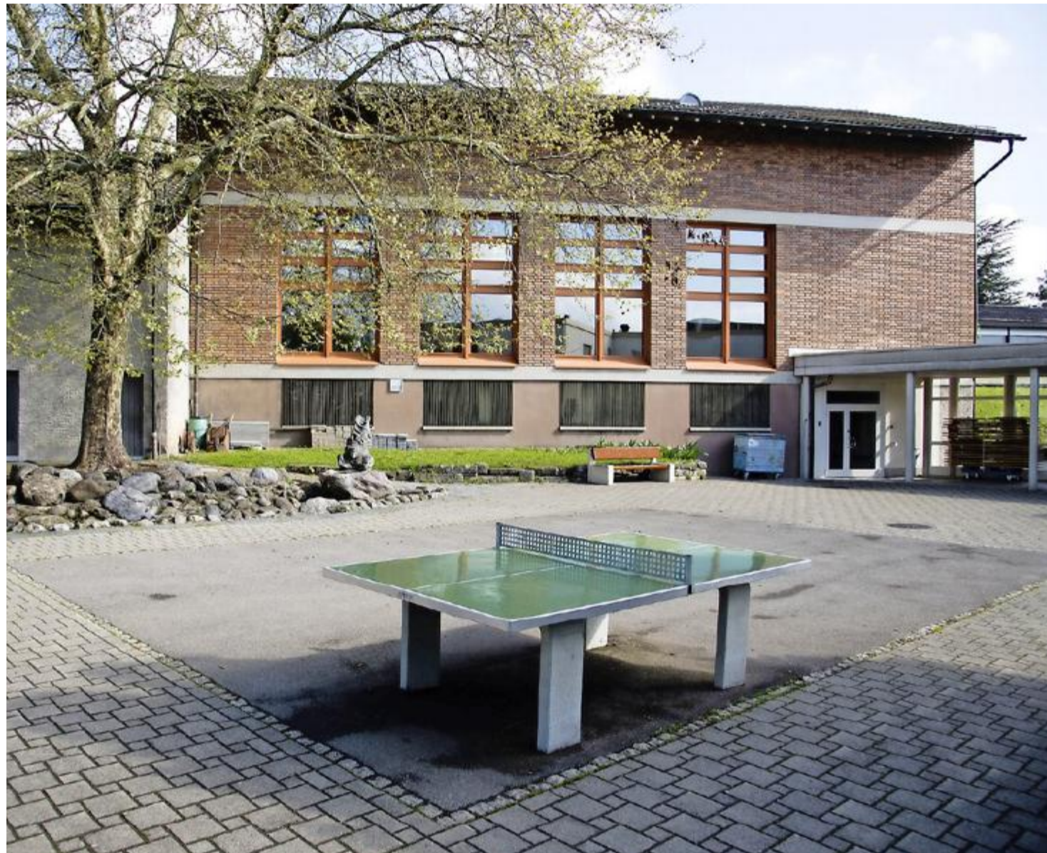
Die Turnhalle Sunneberg ist veraltet und für die heutigen Bedürfnisse zu klein. Bis 2020 soll sie einem Ersatzneubau weichen.

So wäre es beispielsweise möglich, die bisherige Einfachturn-